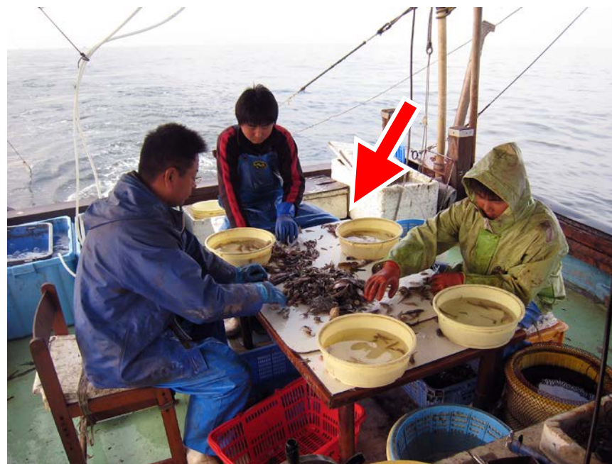
選別作業台の設置例