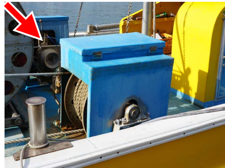
ワープ（曳網）ウィンチに設置した カバーの例