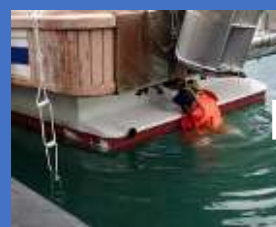
手すりにつかまって船尾の張り出しに乗る