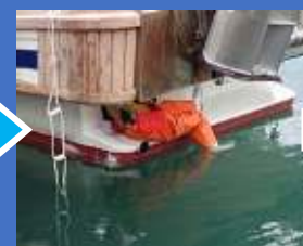
ハッチを押し開けて甲板に登る